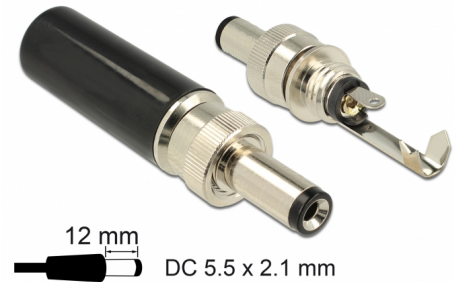
12 mm DC 5.5 x 2.1 mm

Αυτός ο σύνδεσμος DC της Delock είναι φτιαγμένος για τη συγκόλληση σε ένα καλώδιο και μπορεί να χρησιμοποιηθεί για τη σύνδεση διαφορετικών συσκευών με υποδοχή 5,5 x 2,1 χιλ. DC. Ο σύνδεσμος με τη βίδα στην υποδοχή υποστηρίζει σφιχτή σύνδεση με τις κατάλληλες υποδοχές DC.