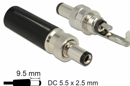
9.5 mm DC 5.5 x 2.5 mm

Αυτός ο σύνδεσμος DC της Delock είναι φτιαγμένος για τη συγκόλληση σε ένα καλώδιο και μπορεί να χρησιμοποιηθεί για τη σύνδεση διαφορετικών συσκευών με υποδοχή 5,5 x 2,5 χιλ. DC. Ο σύνδεσμος με τη βίδα στην υποδοχή υποστηρίζει σφιχτή σύνδεση με τις κατάλληλες υποδοχές DC της Delock π.χ. το αντικείμενο 89911.