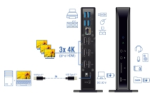
Maximum resolution (depending on the system and the connected hardware)