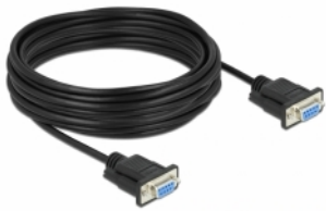
mini Sub-D 9