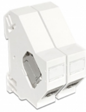
Anwendungsbeispiel mit Stecker