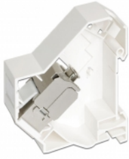
Anwendungsbeispiel mit Stecker