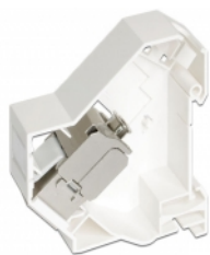
Anwendungsbeispiel mit Stecker