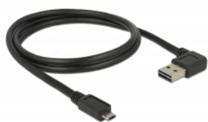
EASY-USB Micro B PCB with both sided contacts