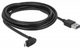
EASY-USB Micro B PCB with both sided contacts