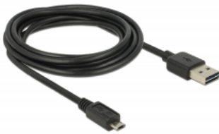
EASY-USB Micro B PCB with both sided contacts