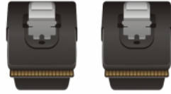
SAS 36 Pin