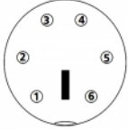
MD-6 Stecker/Male Draufsicht/Frontview

Pin 1: - Pin 4: Schwarz/Black (GND) Pin 2: Weiß/White (RX) Pin 5: - Pin 3: Rot/Red (VCC) Pin 6: Grün/Green (TX)